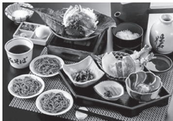
いずし堂「皿そば御膳仙石」