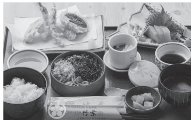
竹葉「和定食(割子そば)」